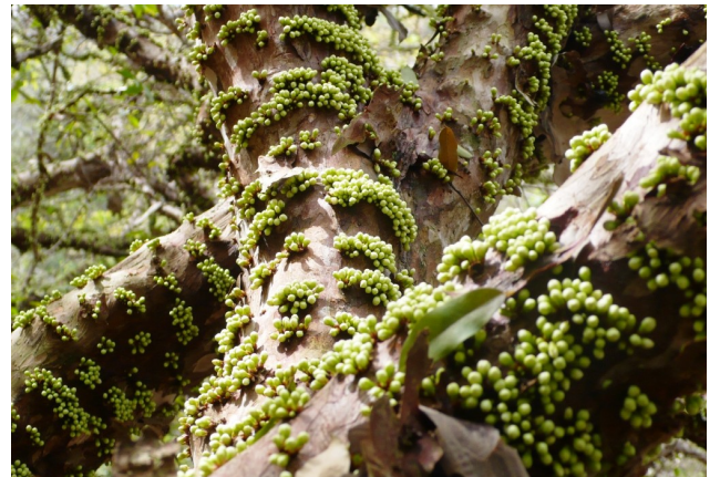
Blüten vor dem Öffnen