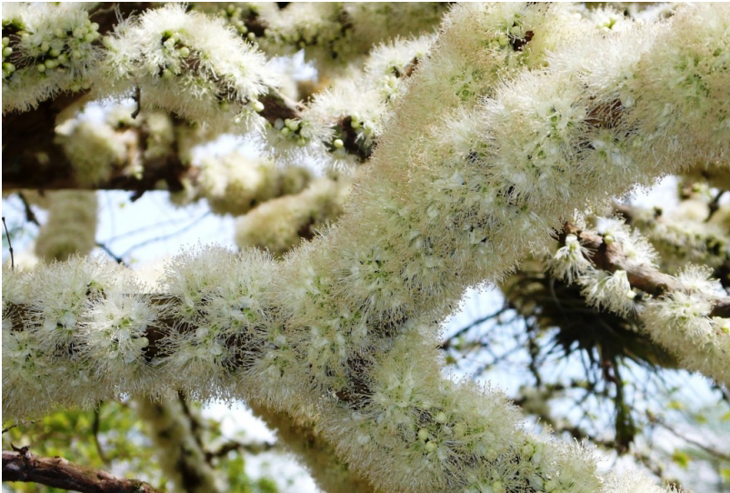
Mit Blüten bedeckte Äste