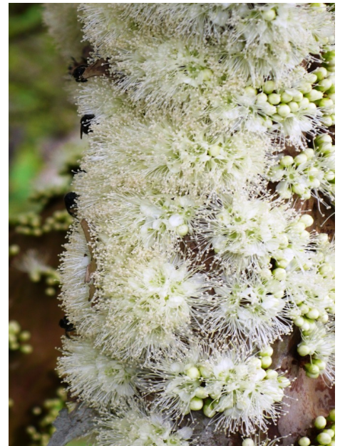
Mit Blüten bedeckte Äste