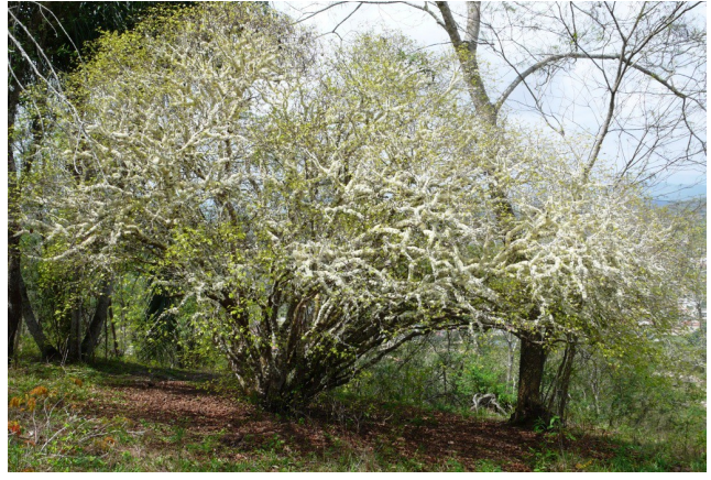
Perspectiva geral na época de florecimento