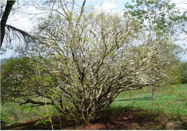
Perspectiva geral na época de florecimento