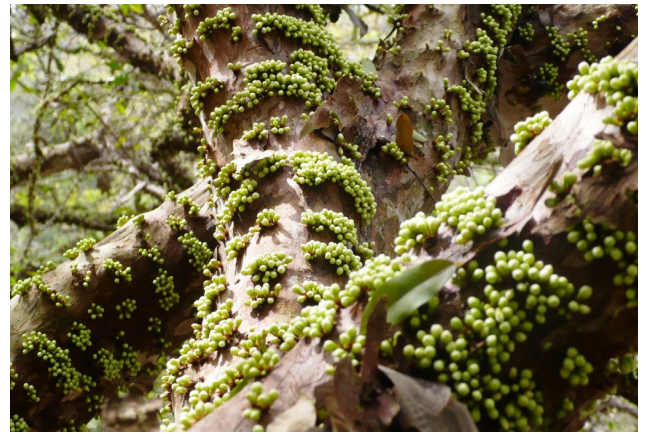
Flores antes da abertura